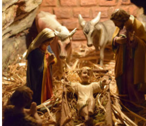
Krippe in Frauenberg

Als sie dort waren, kam für Maria die Zeit ihrer Niederkunft, und sie gebar ihren Sohn, den Erstgeborenen. Sie wickelte ihn in Windeln und legte ihn in eine Krippe, weil in der Her-